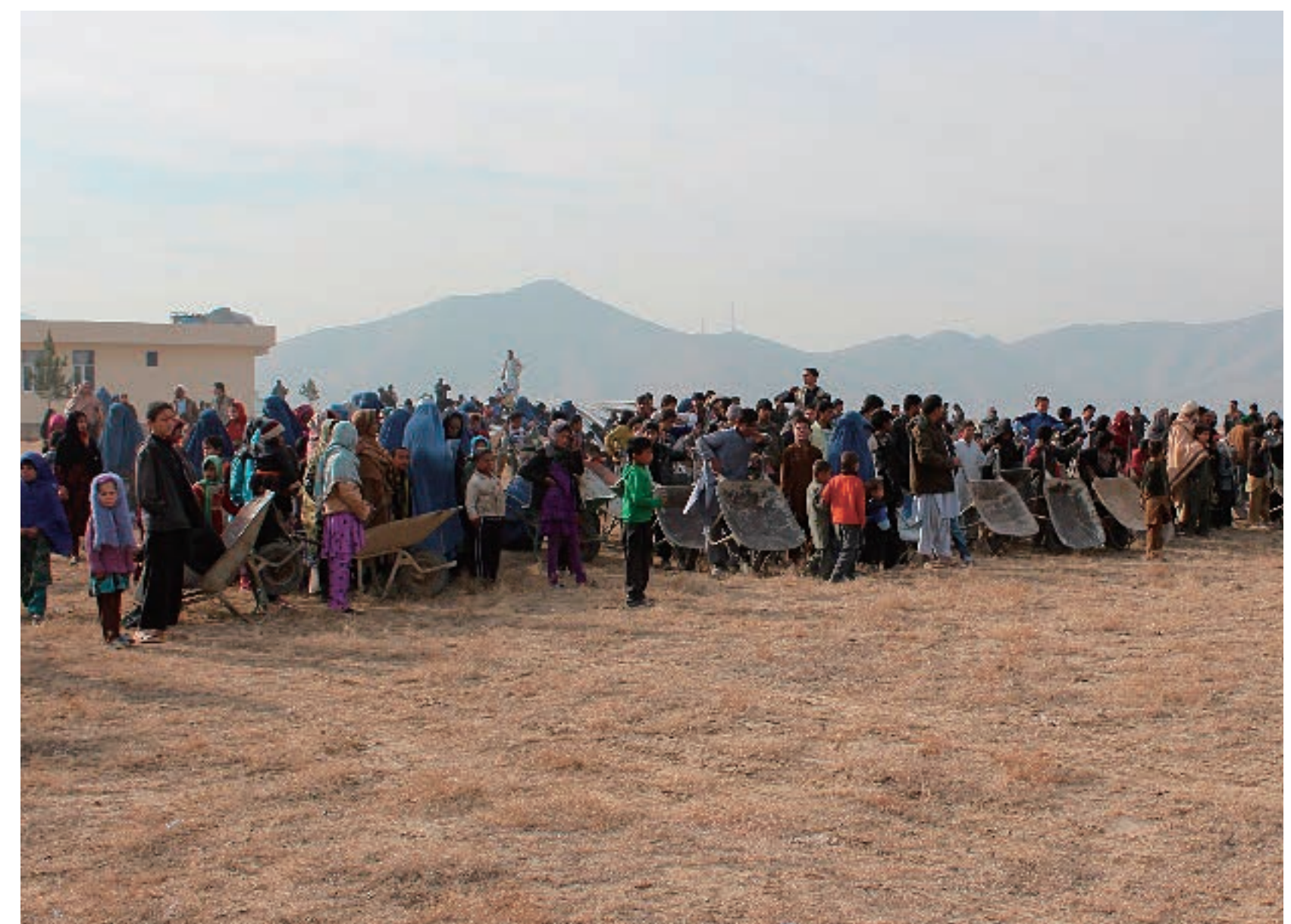
順番を作って食糧の配布を待つ人びと。バリカブ第2キャンプにて