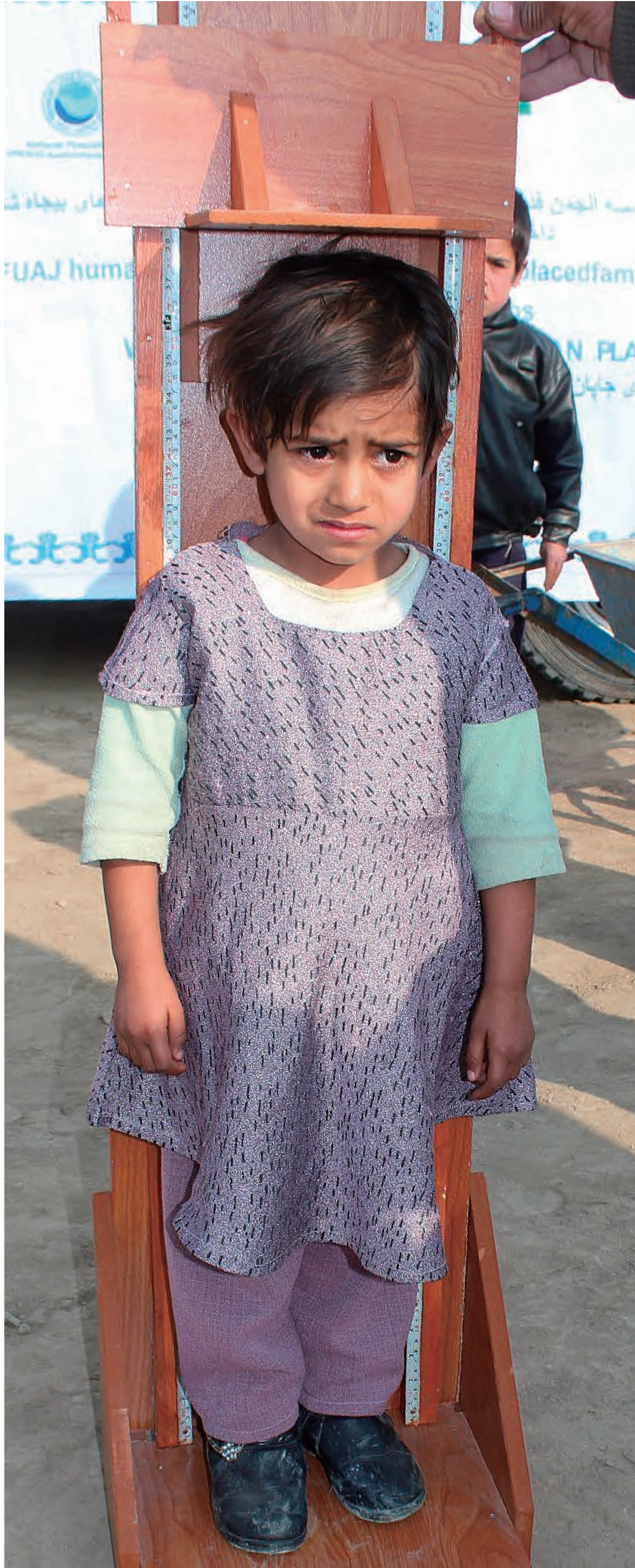
もうちょっとリラックスしていいよ。バリカブ第1キャンプで身長を計ってもらった女の子

National Federation of UNESCO Associations in Japan